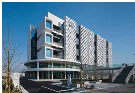
図 1 神戸医療イノベーションセンター (KCMi) 製薬やベンチャー企業向け実験室や再生医療等製品の R&D 用の細胞加工施設などから構成される。当社ソリューションラボは 5 階に入居。(https://www.fbri-kobe.org/kbic/english/facility/ から転載) 所在地：神戸市中央区港島南町 6 丁目 3 番 5 号 (〒650-0047) アクセス：ポートライナー『計算科学センター』駅直結

なお、本パンフレットに記載の内容につきましては、当社の都合により予告なく変更する場合がありますので、その旨ご了解願います。また、デモンストレーションやユーザートレーニング、有償使用の際のご宿泊や交通手段につきましてはお客様にてご手配、ご負担いただくようお願い申し上げます。当社と致しましてはお客様の装置導入のご検討や、実際のご使用がスムーズに進みますように可能な限りの努力を致しますので、本パンフレット記載の内容についてのご質問がありましたら、ご遠慮なく弊社の担当者にお問い合わせください。